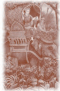
พระบาทสมเด็จพระพุทธเลิศหล้านภาลัย

โผนผกจับไม้อิงมี เหมือนวันพีไกลสามสุตามา เหมือนพีแนบนวลสมจรจินตะหรา เหมือนจากนางสการะวาดี เหมือนร้างห้องมาหยาธรมี เหมือนแก้วพีทั้งสามสั่งความมา เหมือนเวรใดให้หิราศเสน่หา เหมือนพีหับโมงมาเมื่อไกลนาง เหมือนเปล่าเปลี่ยวคับใจในไพรกว้าง คะนึ่งนางพลางรีบโยธี ฯ