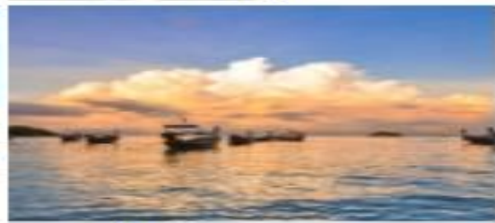
หาดขันเข็ด สตูล