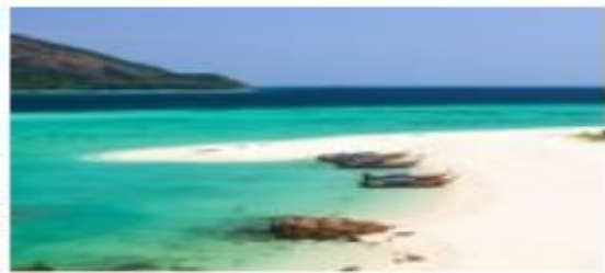
เกาะหลีเป๊ะ สตูล