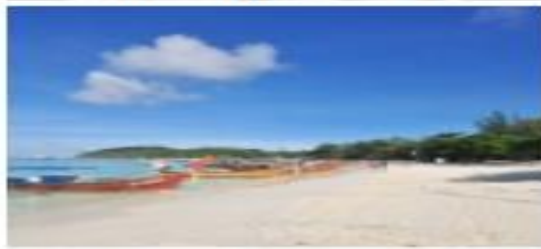
หาดพิทยา สตูล