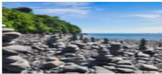
เกาะหินงาม (อุทยานแห่งชาติ